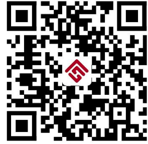
住房公积金权力事项清单