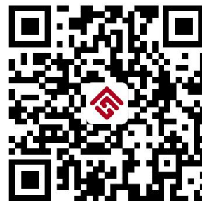
容缺办理事项清单