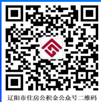
辽阳市住房公积金公众号二维码