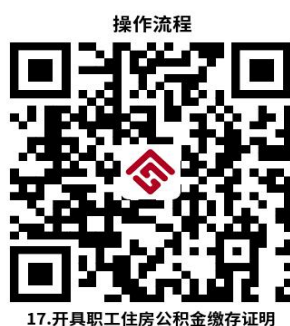
17.开具职工住房公积金缴存证明

③掌上办：手机公积金 APP: https://www.gjj12329.cn/download.jhtml