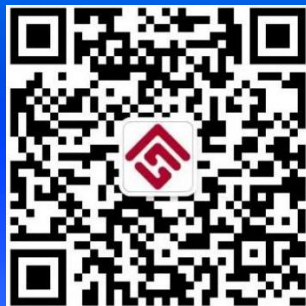
辽阳市住房公积金公众号二维码